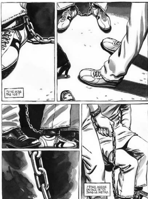
Planche réalisée par Jeanne Puchol, extraite de "Enchaînées", récit sur les mariages forcés.

En présence de Marie Moinard, éditrice et auteure et Jeanne Puchol, scénariste et dessinatrice.